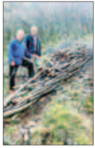
I due boscaioli

AVIO - Un tempo, quando non esistevano i mezzi di oggi, portare a valle la legna tagliata dai boscaioli per far fronte al gelo dell'inverno diventava una fatica non comune. Le fascine venivano fatte scendere lungo resistenti corde di acciaio, i boscaioli formavano una sorta di slitta («caviel» in dialetto) che guidavano, non senza pericolo, dal luogo del taglio verso il fondo valle.